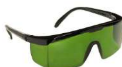
ÓCULOS PROT. VERDE JAGUAR - - KALIPSO - CA:10346 COD: 8038 - AN