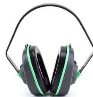
PROTETOR CONCHA ALTERNATIVE - LIBUS COD: 898 - BA