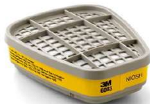
CARTUCHO QUÍMICO 6003 - GA - 3M