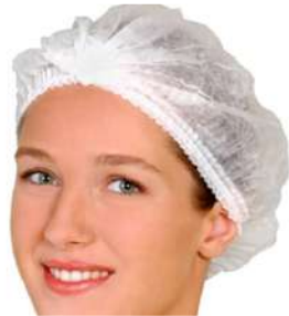
TOUCA FALÇO TECIDO DUPLA C/100 COD: 295 - BA