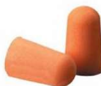
PROTETOR PLUG ESPUMA SEM CORDÃO - 3M COD: 376 - BA