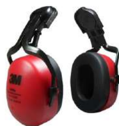
KIT ABAFADOR ACOPLA POMP MUFLER - 3M COD: 462 - BA