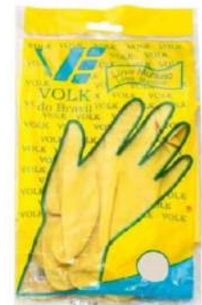
LUVA LATÉX SOFT M / G / GG VOLK - BA