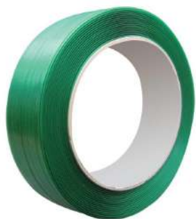
FITA POLIÉSTER RECICLADA 13MM (1700M) COD: 5326 - AN

ballmann@ballmann.com.br (48) 3645 6117 996247236