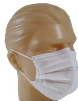
MASCARA FALSO TECIDO COM CLIP DUPLA BR COD: 101 - BA