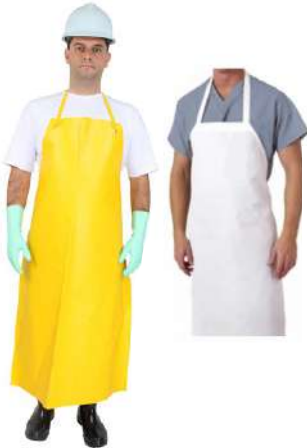
AVENTAL PVC 1,00X0,60 COD: 540 AM - BA COD: 539 BR - BA COD: 388 PT - BA AVENTAL PVC 1,20X0,60 COD: 207 BR - BA