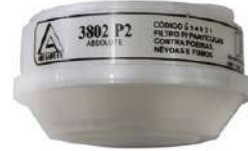
CARTUCHO P2 3802 - AIR SAFETY COD: 7155 - AN