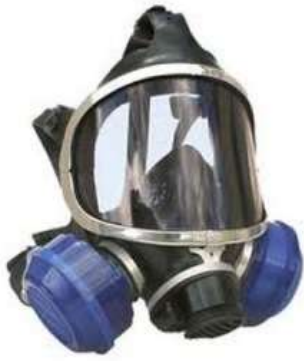
RESPIRADOR FACIAL INTEIRA ABSOLUTE - AIR SAFETY COD: 135 - BA