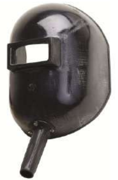
ESCUDO VISOR FIXO PLASTCOR