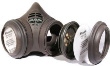
RESPIRADOR ½ PEÇA FACIAL 8812 / 8102 - MOLDEX