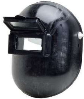
MASCARA VISOR ARTICULAVEL PLASTCOR