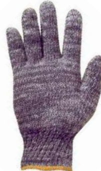
LUVA MALHA MESCLADA VOLK - G KALIPSO - UNICO - BA