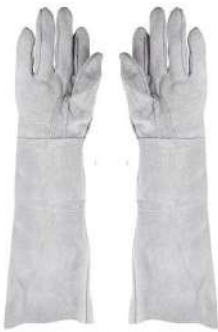
LUVA RASPA 30CM SUPREMA - BA JACOB - BA