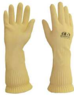
LUVA LONGATEX / RANHURADA P / M / G / XG VOLK - BA DANNY - AN