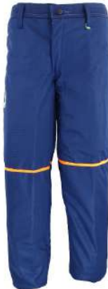
CALÇA ANTI-CORTE MOTOSERRA - G PRO1 COD: 596 - BA