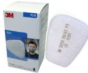
FILTRO P3 5935 - 3M