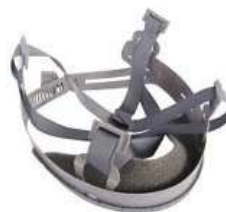
CARNEIRA SIMPLES S/ JUGULAR - MSA