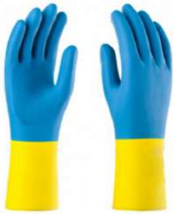
LUVA NEOMIX / BICOLOR P / M / G / XG VOLK / PROTCAP - BA MAPA - AN

ballmann@ballmann.com.br (48) 3645 6117 996247236