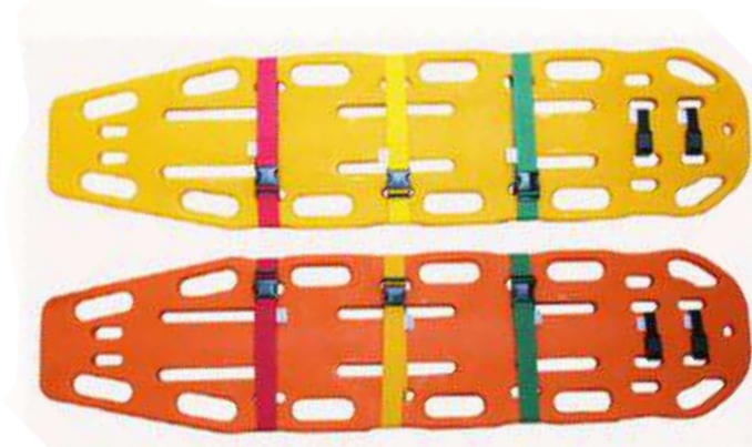
MACA EM POLIETILENO LARANJA COD: 8512 - AN