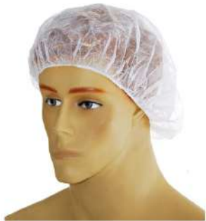
TOUCA DESCARTAVEL TNT SIMPLES C/100 COD: 449 - BA