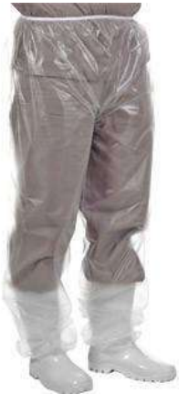
CALÇA PLASTICA TRANSP. C/ ELÁSTICO COD: 251 - BA