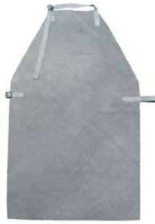
AVENTAL DE RASPA COD: 223 / 1 MT - BA COD: 191 / 1,20 MT - BA