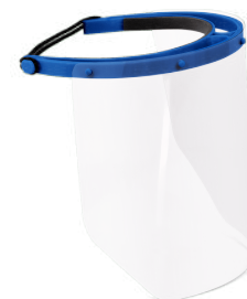
PROTETOR FACIAL INCOLOR MEDICAL COD: 350 - BA