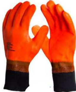
LUVA ICE GLOVE TÉRMICA LARANJA - G DANNY - BA