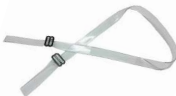
JUGULAR P/ CAPACETE SILICONE - PLASTCOR