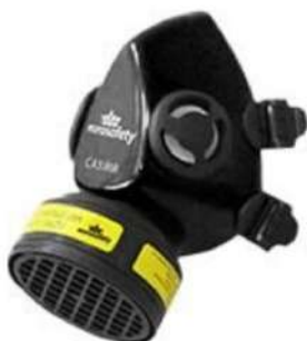
RESPIRADOR 1/4 FACIAL 700 - EURO SAFETY