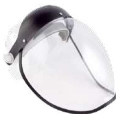
PROTETOR FACIAL INCOLOR ANATÔMICO - CA 2207 COD: 795 - BA