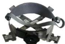
CARNEIRA C/ CATRACA TRACK III - MSA