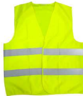
COLETE SINALIZAÇÃO VERDE COD: 710