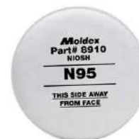
FILTRO MECÂNICO P1 - MOLDEX