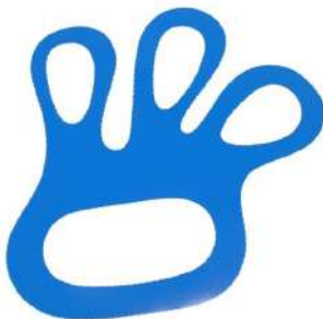
FIXADOR DE LUVA MALHA DE AÇO COD: 670 - BA