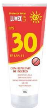
CREME BLOQUEADOR C/ REPELENTE 30 - LUVEX COD: 420 - BA