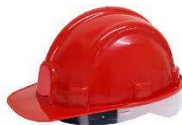
CAPACETE ABA FRONTAL C/ CARNEIRA - PLASTCOR