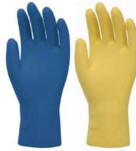
LUVA LATEX VERNIZ SILVER P / M / G VOLK - BA KALIPSO - BA