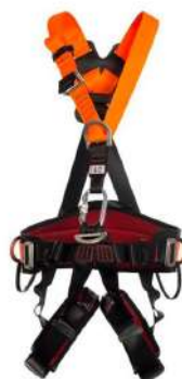
CINTO PARAQUEDISTA 5 ARGOLAS COD: 200 - BA