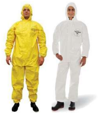
MACACÃO TYVEK BR - BA COD: 89P/ 88M / 87G /90XG MACACÃO TICHEM AM COD: 378G - BA