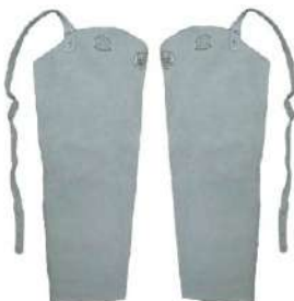
MANGOTE DE RASPA COD: 224 - BA