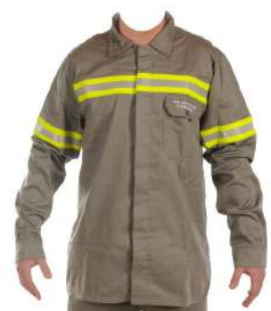
CAMISA NR 10 RISCO 2 ANTI-CHAMA COD: 584 - BA