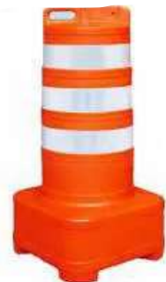
CONE BALIZADOR 75 CM