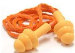
PROTETOR PLUG SILICONE MAXXI COD: 284 - BA