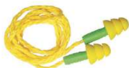
PROTETOR PLUG SILICONE POMPMILENIUM - P/M/G - 3M COD: 549-P / 550-M / 551-G - BA