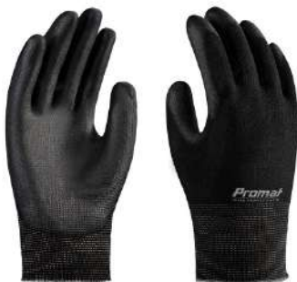
LUVA PU MULTITATO P / M / G / GG VOLK - BA