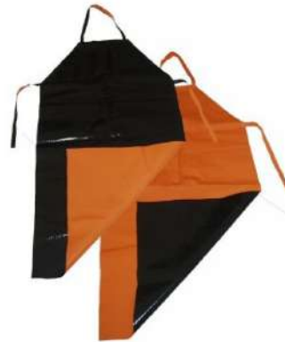
AVENTAL KP 1000 1,20X0,70 COD: 181 - BA