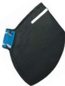
RESPIRADOR PFF2 VO SEM VÁLVULA COD: 23 - BA