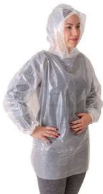
BATA PLASTICA C/ ELÁSTICO. TRANSPARENTE COD: 638 - BA