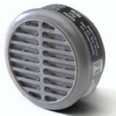
CARTUCHO QUÍMICO 8100 VO - MOLDEX