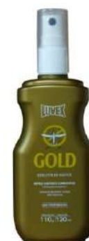
CREME SPREY GOLD REPELENTE - LUVEX COD: 582 - BA