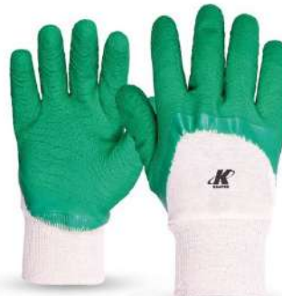
LUVA NITRILON M / G KALIPSO - BA DANNY - BA