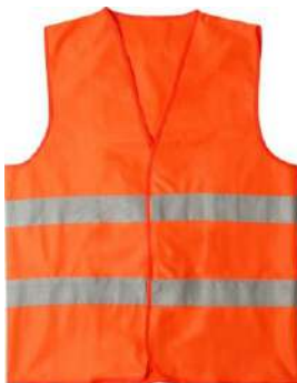
COLETE SINALIZAÇÃO LARANJA COD: 709