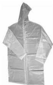
CAPA DE CHUVA CRISTAL COD: 583M / 558G / 363XG - BA