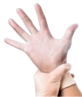
LUVA VINILICA DESCART. P / M / G