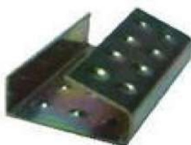
SELO BICROMATIZADO 16MM COD: 7031 - AN