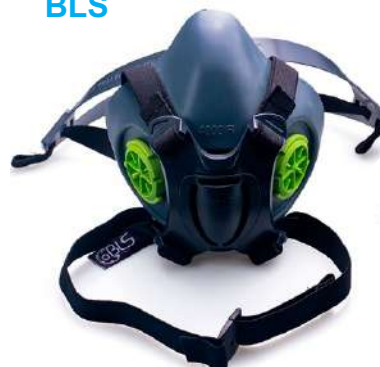
RESPIRADOR 1/4 FACIAL 4000 - BLS