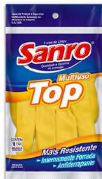
LUVA LATÉX TOP AM P / M / G / GG SANRO - BA