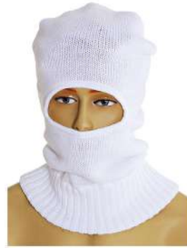
TOUCA DE LÃ ACRILICA NINJA - BRANCA COD: 466 - BA