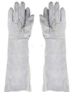
LUVA RASPA 20CM SUPREMA - BA JACOB - BA