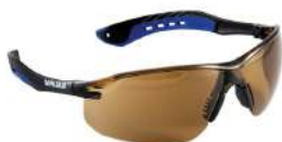
ÓCULOS PROT. MARROM KALIPSO - JAMAICA - CA: 35156 COD: 523 - BA