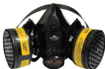
RESPIRADOR 1/4 FACIAL FENIX 2 - EURO SAFETY