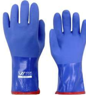
LUVA FRIO VOLK TÉRMICA - EG COD: 173 - BA