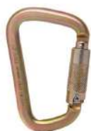
MOSQUETÃO TRIPLA TRAVA TIPO PERA - 41kn COD: 7895 - AN