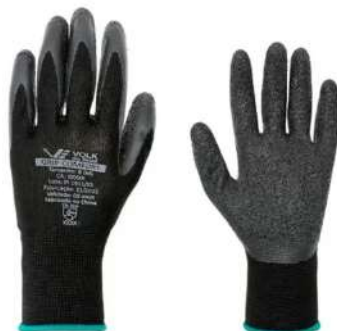
LUVA GRIP CONFORT G VOLK - BA