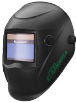
MÁSCARA SOLDA AUTO ESCURECIMENTO NOVA CARRERA - CARBOGRAFITE

ballmann@ballmann.com.br (48) 3645 6117 996247236