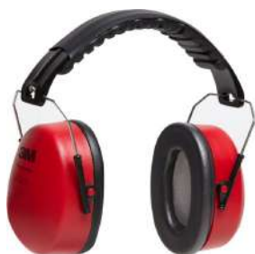
PROTETOR AURICULAR POMP MUFFLER - 3M COD: 233 - BA