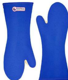
LUVA 2 DEDOS TERMICA BENETHERM COD: 8741 - AN