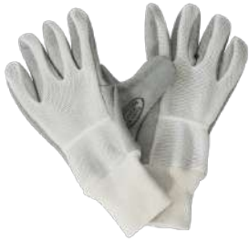
LUVA RASPA MOLETON SUPREMA - BA COD: 100

ballmann@ballmann.com.br (48) 3645 6117 996247236