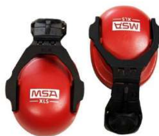
KIT ABAFADOR ACOPLA XLS - MSA COD: 262 - BA