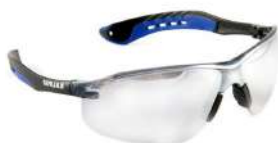
ÓCULOS PROT. INCOLOR KALIPSO - JAMAICA - CA: 35156 COD: 74 - BA