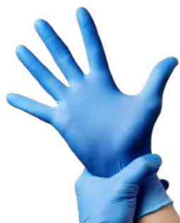
LUVA NITRILICA SEM PÓ P / M / G / XG