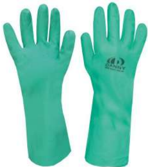
LUVA NITRÍLICA P / M / G / XG KALIPSO - BA