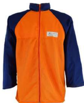
CAMISA ANTI-CORTE MOTOSERRA - G PRO1 COD: 597 - BA