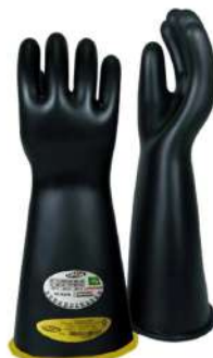
LUVA ISOLANTE ALTA TENSÃO CLASSE 00 / 1 / 2 ORION - BA