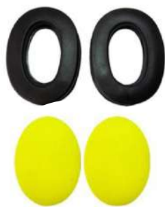
KIT ESPUMA/ALMOFADA SPR - AGENA