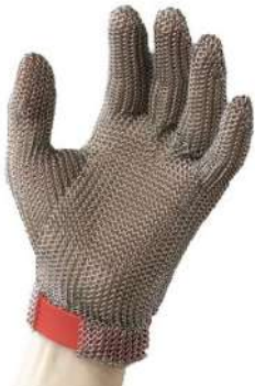
LUVA MALHA DE AÇO PP / P / M / G / GG CHINAMEX - BA