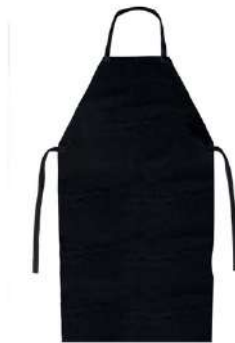
AVENTAL EM LONA CAQUI PRETO COD: 7962 - AN