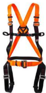
CINTO PARAQUEDISTA EM NYLON COD: 456 - BA

ballmann@ballmann.com.br (48) 3645 6117 996247236