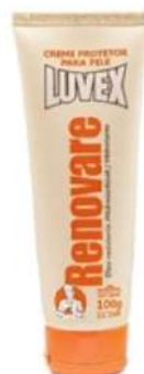
CREME RENOVARE 100G LUVEX COD: 674 - BA