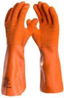
LUVA MAX LUVA TÉRMICA LARANJA - G VOLK - BA DANNY - BA

ballmann@ballmann.com.br (48) 3645 6117 996247236