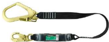
TALABARTE I FITA ABS ENGATE: 56MM COD: 304 - BA