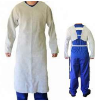
AVENTAL BARBEIRO EM RASPA COD: 226 S/ GOLA - BA COD: 227 C/ GOLA - BA