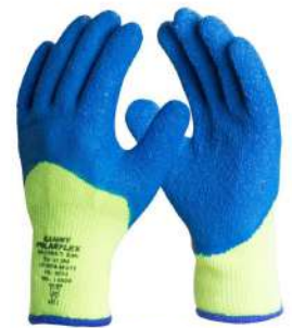
LUVA POLAR FLEX TÉRMICA - G COD: 483 - BA