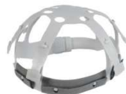
CARNEIRA SIMPLES PLASTCOR