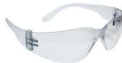
ÓCULOS PROT. INCOLOR LEOPARDO - KALIPSO - CA: 11268 COD: 168 - BA