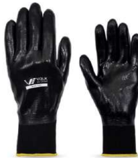
LUVA NITRIL FULL M / G VOLK - BA