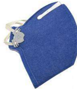
RESPIRADOR PFF2 SEM VÁLVULA COD: 21 - BA