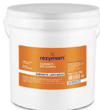
SABOBETE ESFOLIANTE LARANJA / LIMÃO REZYMOM - 3 KG