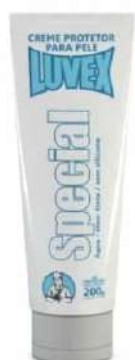
CREME SPECIAL 200G LUVEX COD: 362 - BA