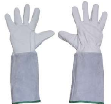
LUVA VAQUETA PUNHO RASPA 20 CM COD: 397 - BA