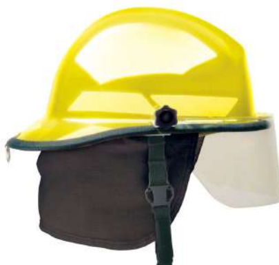
CAPACETE BOMBEIRO C/ VISEIRA - MODELO PX