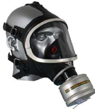
RESPIRADOR FACIAL INTEIRA FULL FACE RB - AIR SAFETY COD: 354 - BA