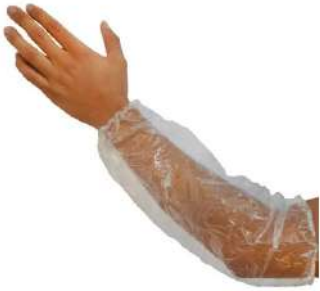
MANGA PLASTICA TRANSP C/ ELASTICO COD: 224 - BA

ballmann@ballmann.com.br (48) 3645 6117 996247236