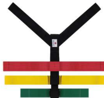
CINTO IMOBILIZADOR ARANHA COD: 7298 - AN