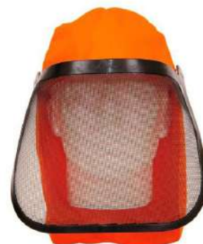
BONÉ C/ PROTETOR TELA FACIAL / NUCA