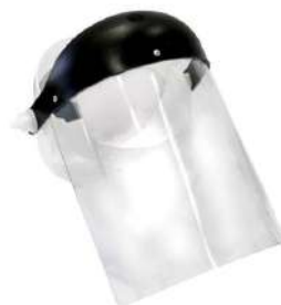
PROTETOR FACIAL INCOLOR MAX - PLASTCOR CA 15019 COD: 785 - BA