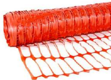
TELA TAPUME LARANJA 1,20 X 50 MT