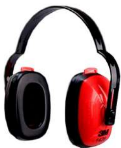
PROTETOR AURICULAR 1426 - 3M COD: 432 - BA