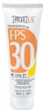
CREME BLOQUEADOR S/ REPELENTE 30 - LUVEX COD: 481 - BA

ballmann@ballmann.com.br (48) 3645 6117 996247236