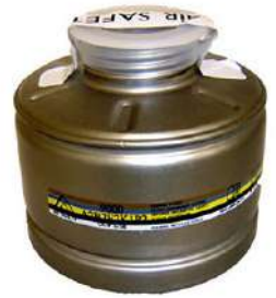
CARTUCHO QUÍMICO 9000 - AIR SAFETY COD: 6597 - AN