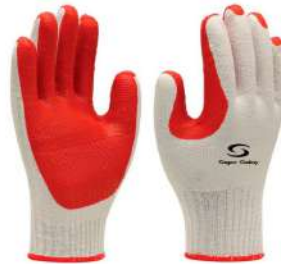
LUVA VULCANIZADA RUBBER - SS COD: 410 - BA