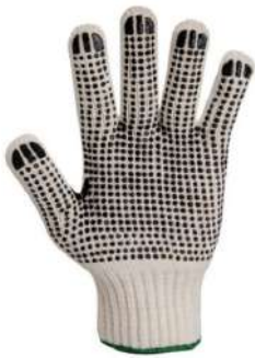
LUVA MALHA PIGMENTADA VOLK - G - BA KALIPSO - UNICO - BA