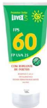
CREME BLOQUEADOR C/ REPELENTE 60 - LUVEX COD: 421 - BA