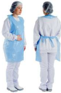
AVENTAL DESCARTÁVEL 1,50X0,80X002 COD: 184 - BA