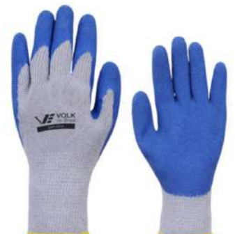
LUVA GRIP VOLK G VOLK - BA