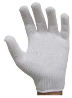
LUVA HELANCA BRANCA VOLK - G - BA KALIPSO - UNICO - BA