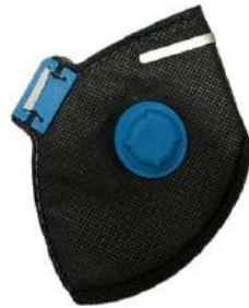
RESPIRADOR PFF2 VC COM VÁLVULA COD: 24 - BA