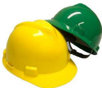
CAPACETE SEGURANÇA C/ CARNEIRA - MSA