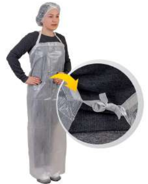
AVENTAL XF 1,50X0,70X65 COD: 165 - BA