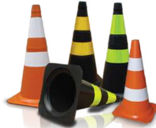
CONE BORRACHA 50 CM ■■■ CONE BORRACHA 75 CM ■■■ CONE PVC 50 CM ■■■