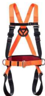
CINTO PARAQUEDISTA 3 ARGOLAS COD: 630 - BA