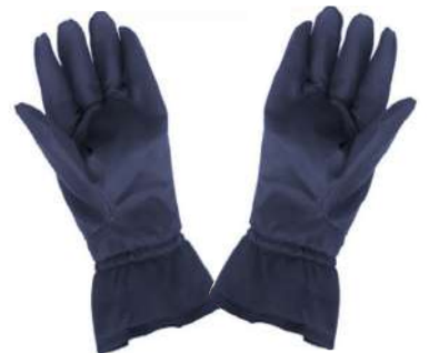
LUVA NYLON AZUL TÉRMICA -35° COD: 535 - BA