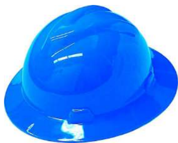
CAPACETE ABA TOTAL S/ CARNEIRA - MSA

ballmann@ballmann.com.br (48) 3645 6117 996247236