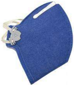
RESPIRADOR PFF1 SEM VÁLVULA COD: 19 - BA