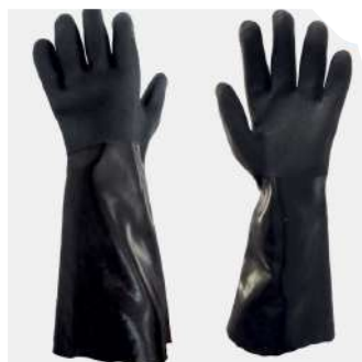
LUVA PVC PETRONIT 27CM / 36 CM KALIPSO