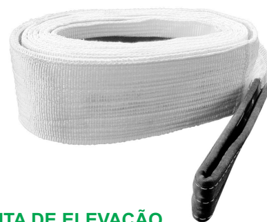
FITA DE ELEVAÇÃO