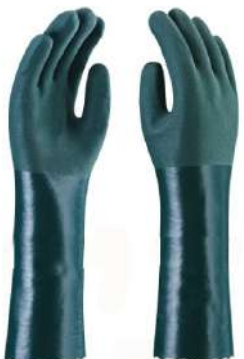
LUVA PVC 27CM / 35 CM 60CM / 70 CM KALIPSO - BA PLASTCOR - BA