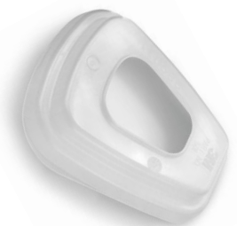
RETENTOR P/ FILTRO 3M