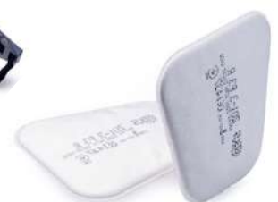
FILTRO P3 BLS