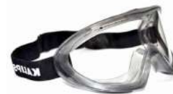
ÓCULOS AMPLA VISÃO ANGRA - - KALIPSO COD: 482 - BA