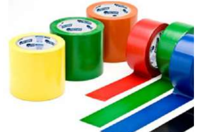
FITA DEMARCAÇÃO DE SOLO 50MM X 30MT