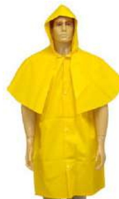
CAPA DE CHUVA MORCEGO COD: 620G / 619XG - BA