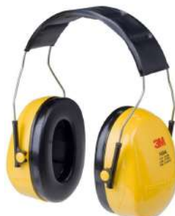
PROTETOR AURICULAR H9A - 3M COD: 835 - BA