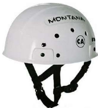
CAPACETE SEGURANÇA FOCUS - MONTANA