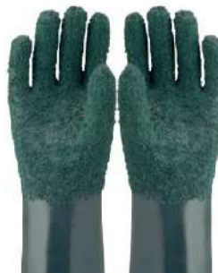
LUVA PVC GRANULADA 26 CM / 37 CM PLASTCOR