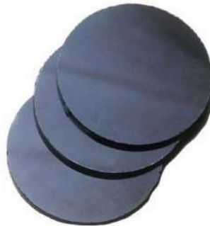
LENTES P/ MASCARA SOLDA TON: 10/12/14