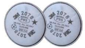
FILTRO MECÂNICO P2 2078 - 3M