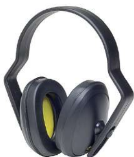
PROTETOR CONCHA SPR AGENA COD: 220 - BA

ballmann@ballmann.com.br (48) 3645 6117 996247236