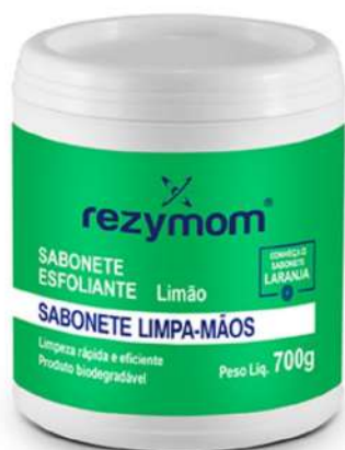
SABOBETE ESFOLIANTE REZYMOM - 700G COD: 599 - BA