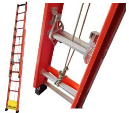
ESCADA DE FIBRA VAZADA 3,60 X 6,00 MT 4,20 X 7,20 MT