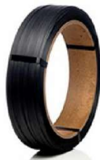
FITA POLIPROPILENO PRETA 13MM - 5,5 KG COD: 6643 - AN