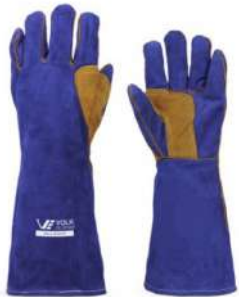
LUVA ALTA TEMP. / SOLDA COD: 266 - BA