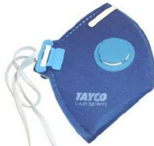
RESPIRADOR PFF1 COM VÁLVULA COD: 20 - BA