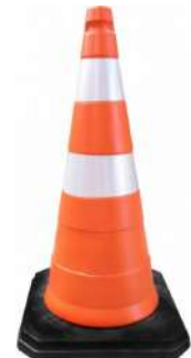
CONE BASE DE BORRACHA 75 CM COD: 6058 - AN