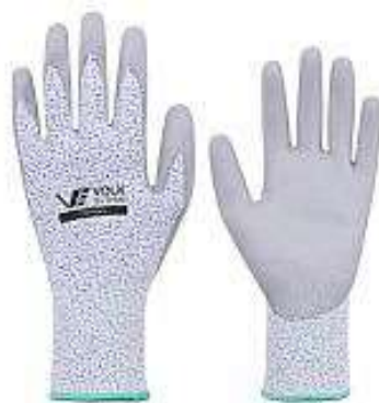
LUVA CUT VOLK RESIST. CORTE DE VIDRO COD: 00038 - AN