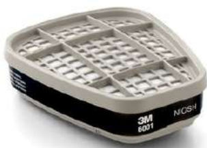
CARTUCHO QUÍMICO 6001 - VO - 3M