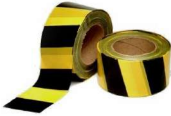
FAIXA SINALIZAÇÃO ZEBRADA - PLASTCOR COD: 178 - BA

ballmann@ballmann.com.br (48) 3645 6117 996247236