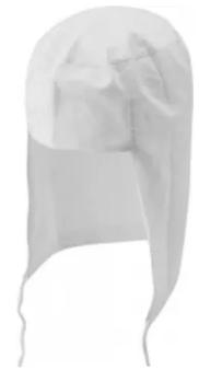
TOUCA DE MALHA ARABE - BRANCA COD: 345 - BA