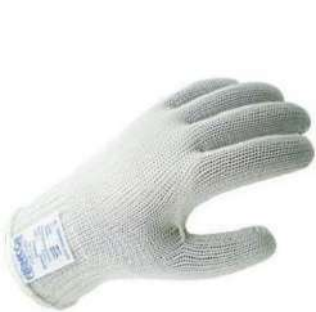
LUVA MALHA C/ 2 FIOS DE AÇO TAM: 8 / 9 / 10 / 11 FIANCOR - BA