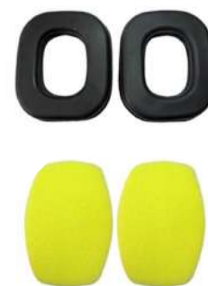
KIT ESPUMA/ALMOFADA ATR - AGENA