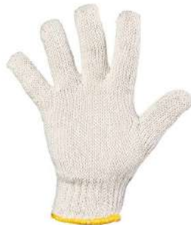
LUVA MALHA BRANCA VOLK - G - BA KALIPSO - UNICO - BA