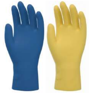
LUVA LATEX VERNIZ SLIM P / M / G VOLK - BA