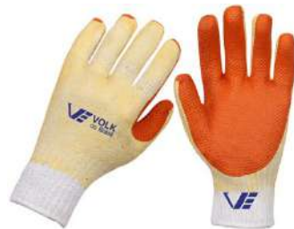
LUVA VULCANIZADA ORANGE - VOLK COD: 001 - BA