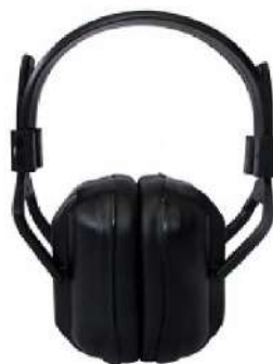
PROTETOR CONCHA ATR AGENA COD: 219 - BA