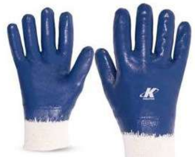
LUVA NITRÍLICA / TECIDO G / XG KALIPSO - BA VOLK - BA