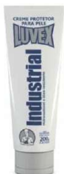
CREME INDUSTRIAL 200G LUVEX COD: 387 - BA