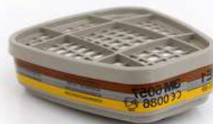
CARTUCHO QUÍMICO 6006 VO / GA - 3M