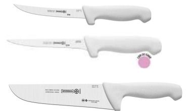
FACAS PROFISSIONAIS AÇOGUEIRO 20CM CARNE 15 / 20CM DESOSSAR 15CM MUNDIAL