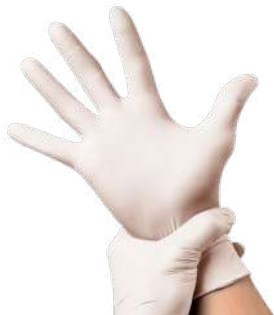
LUVA PROCED. DESC. LATEX . XP / P / M / G