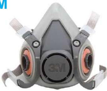
RESPIRADOR ½ PEÇA FACIAL 6200 - 3M