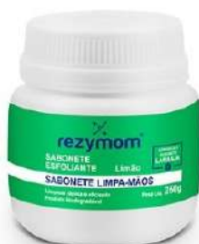
SABOBETE ESFOLIANTE REZYMOM - 250G COD: 598 - BA