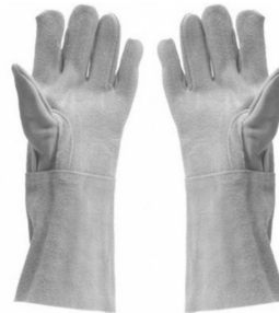
LUVA RASPA 15CM SUPREMA - BA JACOB - BA