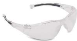
ÓCULOS PROT. INCOLOR A 805 - UVEX - CA: 18821 COD: 5008 - AN

ballmann@ballmann.com.br (48) 3645 6117 996247236