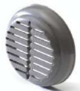
RETENTOR FILTRO MOLDEX