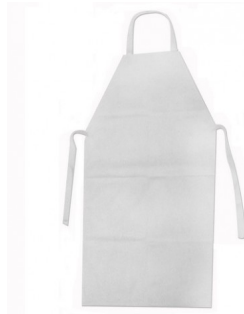
AVENTAL SILICONE 1,20X0,65 COD: 254 - BA