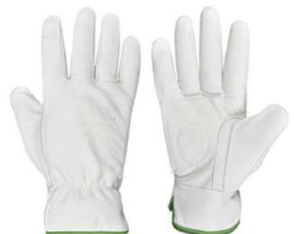
LUVA VAQUETA CONFORTO - BA KOCH - BA SOFT - BA