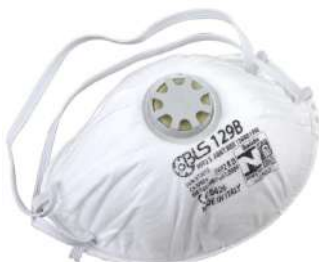
RESPIRADOR - PFF2 129B - C/ VÁLVULA - VOLK COD: 110 - BA