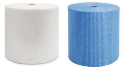
PANO MULTIUSO AZUL /BRANCO 28X300MT