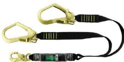
TALABARTE Y FITA ABS ENGATE: 56MM COD: 204 - BA