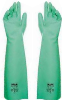
LUVA NITRÍLICA LONGA P / M / G / XG MAPA - BA