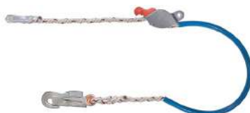
TALABARTE CORDA REG. INOX COD: 199 - BA