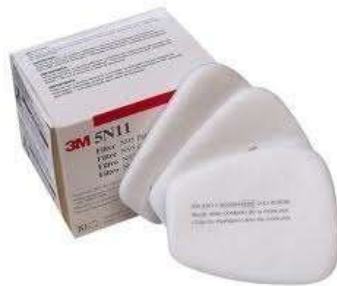
FILTRO POEIRAS E NÉVOAS 5N11 - 3M