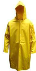
CAPA DE CHUVA C/MANGA COD: 650M/ 216G / 217XG - BA