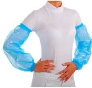
MANGA POLIETILENO DESCT. C/ ELASTICO AZUL COD: 141 - BA