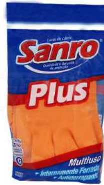
LUVA LATÉX PLUS LAR. P / M / G / GG SANRO - BA