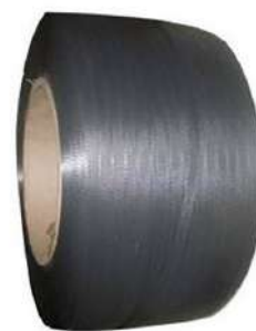
FITA POLIPROPILENO PRETA 10MM - 10 KG COD: 7634 - AN