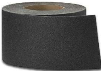
FITA ANTI-DERRAPANTE 50MM X 30MT