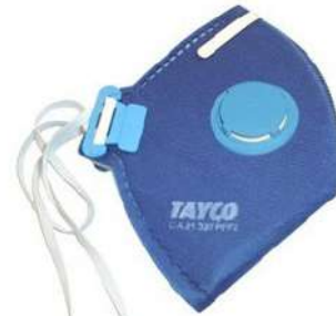
RESPIRADOR PFF3 COM VÁLVULA - COD: 25 - BA