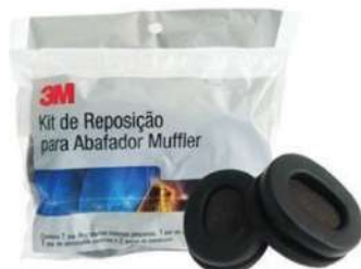
KIT REPOSIÇÃO POMP MUFFLER - 3M COD: 346 - BA