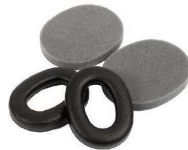
KIT HIGIENE REPOSIÇÃO HPE - 3M