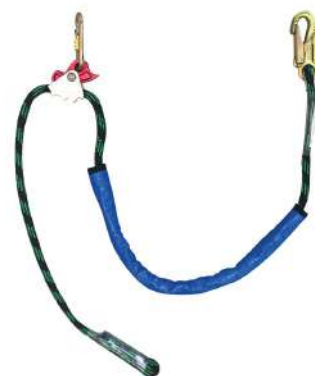
TALABARTE POSICIONAMENTO CORDA C/ REG. EM ALUMINIO. COD: 205 - BA