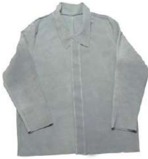
BLUSÃO DE RASPA COD: 6208 - AN

ballmann@ballmann.com.br (48) 3645 6117 996247236