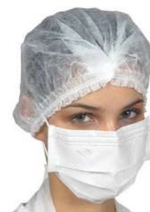
MASCARA FALSO TECIDO COM CLIP TRIPLA BR COD: 836 - BA