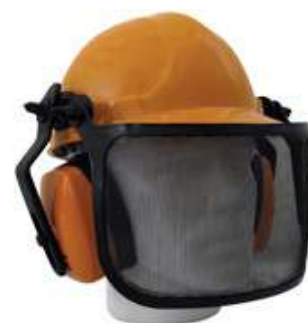
CAPACETE SEGURANÇA TELA E ABAFADOR - TECMATER