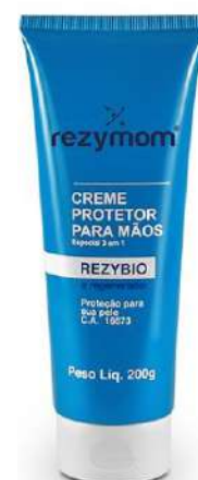
CREME SPECIAL 3 EM 1 REZYMOM - 200G COD: 600 - BA