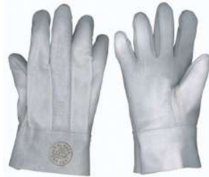
LUVA RASPA 7CM SUPREMA - BA JACOB - BA