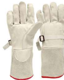
LUVA DE COBERTURA VAQUETA / RASPA COD: 568 - BA