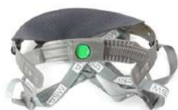
CARNEIRA C/ CATRACA PUSH KEY - MSA