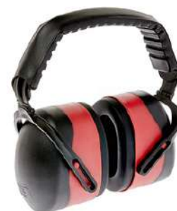
ABAFADOR CONCHA CG-PTF223 - CARBOGRAFITE COD: 971 - BA