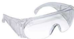
ÓCULOS SOBREPOR PANDA - KALIPSO CA:10344 COD: 765 - BA