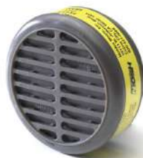
CARTUCHO QUÍMICO 8300 VO+GA - MOLDEX