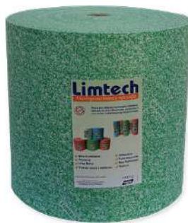
PANO MULTIUSO ESPECIAL VERDE - 300MT - OBER COD: 855 - BA