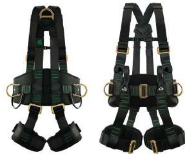
CINTO PARAQUEDISTA 5 ARGOLAS / CADEIRINHA COD: 203 - BA