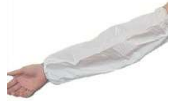
MANGA POLIETILENO LEITOSO C/ ELÁSTICO COD: