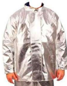
BLUSÃO ARAMIDA CARBONO ALTA TEMPERATURA - GG COD: 556 - BA