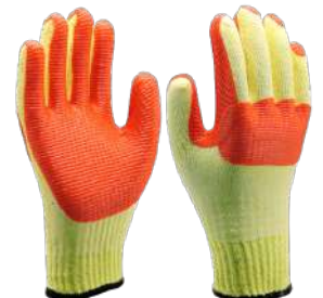
LUVA VULCANIZADA RUBBER RED SKIN COD: 544 - BA