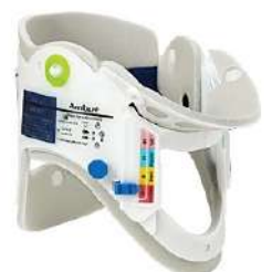
COLAR CERVICAL 4x1 COD: 7311 - AN