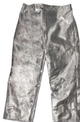
CALÇA ARAMIDA CARBONO ALTA TEMPERATURA - GG COD: 557 - BA