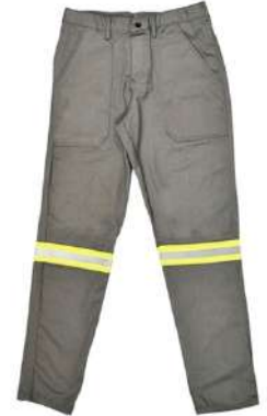
CALÇA NR 10 RISCO 2 ANTI-CHAMA COD: 585 - BA